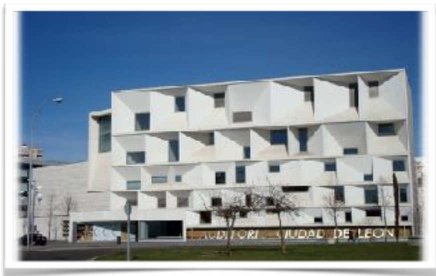
Auditorio de León.